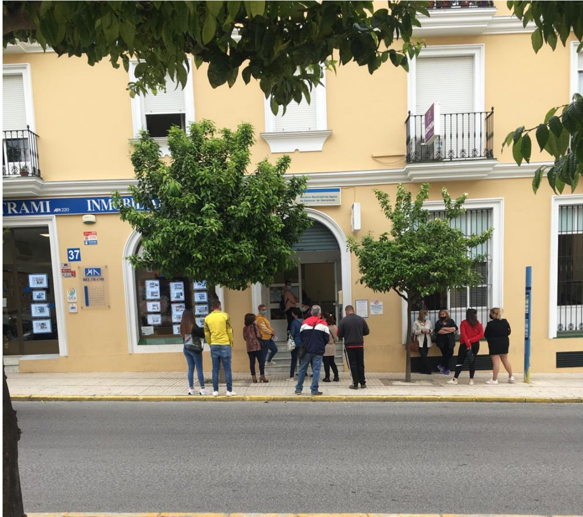
Colas producidas en las Oficinas de Hermanos Fermín por el cierre de las oficinas de Bonanza